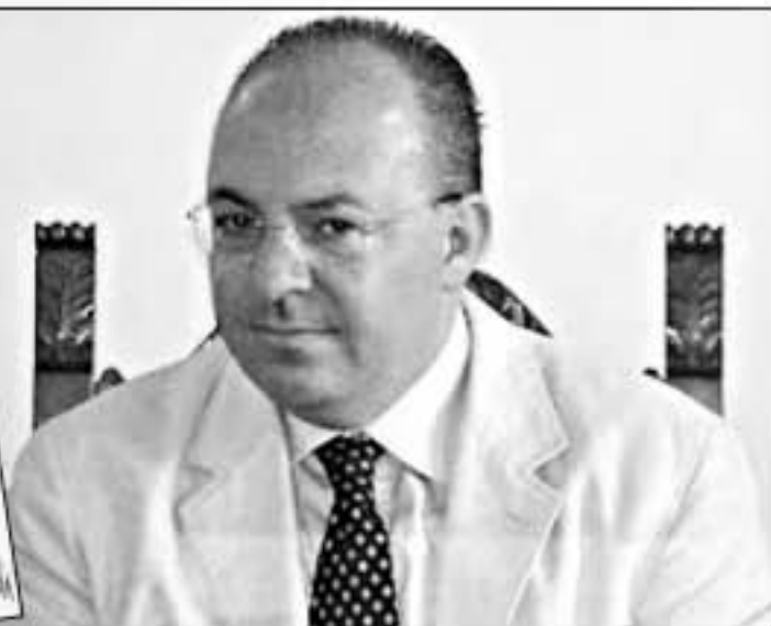
Η επιστολή του Ιταλού δημάρχου προς τους μαθητές του Πειραματικού Λυκείου Μυτιλήνης και ο ίδιος ο Μάρκο Γκάλντι

σπουδάζεις ή να ειδικεύεσαι, χωρίς καμμία βεβαιότητα για την εύρεση κατάλληλης εργασίας στο δικό σου τόπο, χωρίς μια θέση στην κοινωνία. Γι' αυτό σάς νιώθω πολύ κοντά και θέλω να κάνω τα πάντα για να σας υποστηρίξω. Προς το παρόν, σας διαβεβαιώνω ότι δεσμευόμαστε στην Ιταλία και την Ευρώπη ότι θα συνεχίσουμε να επδεικνύουμε το σεβασμό και την αλληλεγγύη που δικαιούται η Ελλάδα. Η Ευρώπη, με τον πολιτισμό και τις παραδόσεις της, με την ταυτότητά της, θα πρέπει να έχει συνείδηση του δυναμικού της στον κόσμο και οι νεολαίοι της, γαλουχημένοι στον πολιτισμό της, μπορούν να κάνουν τη διαφορά. Ως